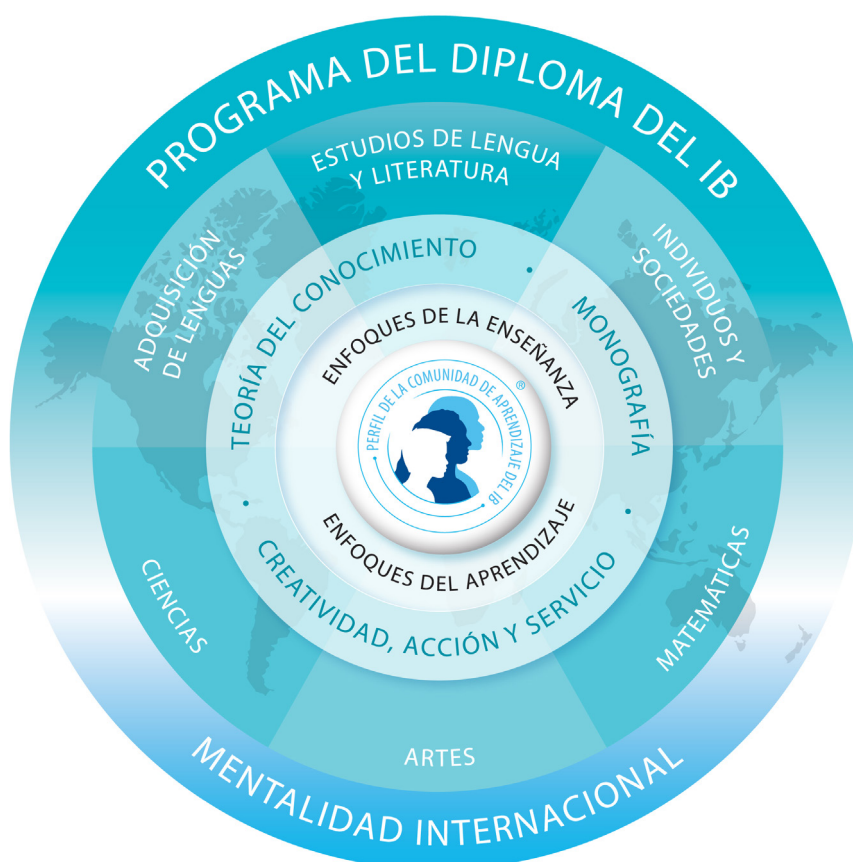
Figura 1 Modelo del Programa del Diploma

El curso se representa mediante seis áreas académicas dispuestas en torno a un núcleo (véase la figura 1); esta estructura fomenta el estudio simultáneo de una amplia variedad de áreas académicas. Los alumnos estudian dos lenguas modernas (o una lengua moderna y una clásica), una asignatura de ciencias humanas o ciencias sociales, una ciencia experimental, una asignatura de matemáticas y una de artes. Esta variedad hace del Programa del Diploma un programa exigente y muy eficaz como preparación para el ingreso a la universidad. Además, en cada una de las áreas académicas los alumnos tienen flexibilidad para elegir las asignaturas en las que estén particularmente interesados y que quizás deseen continuar estudiando en la universidad.